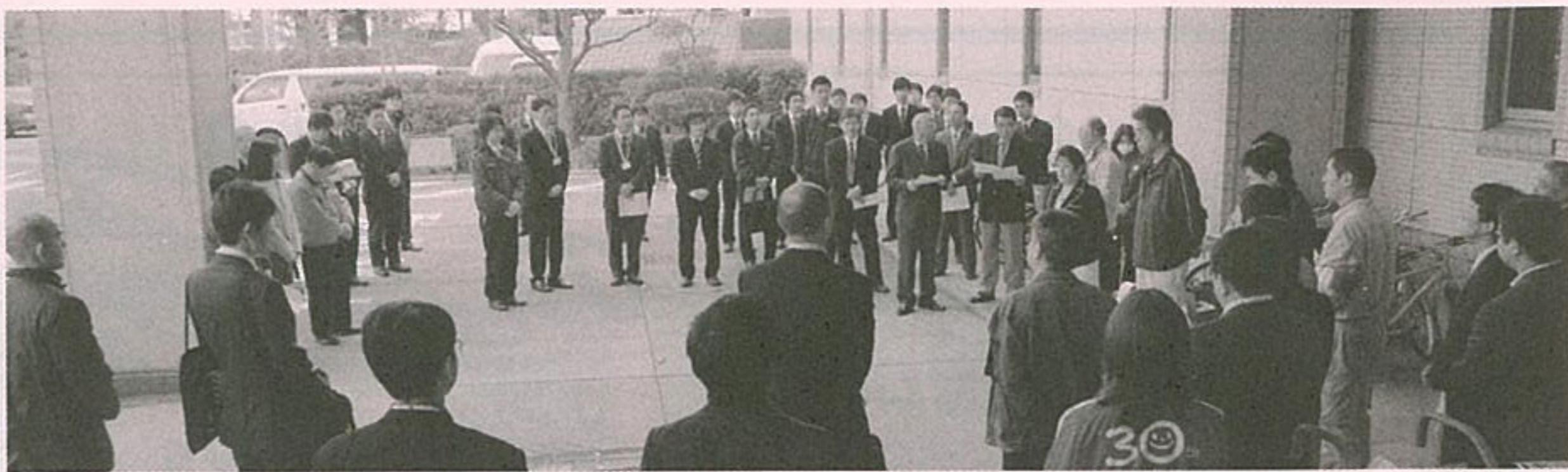
○福祉用具研修会 2010/3/20 (岩国市) シンフォニア岩国 毎年、岩国地区では「福祉用具体験展示会」として岩国医療センター医師会病院で開催してありました。4回目となる

今年は山口県福祉用具協会との共催として会場を「シンフォニア岩国」に移し、参加メーカーも66社に膨れ上がり、「山口福祉機器展 2010 in 岩国」と題して行われました。